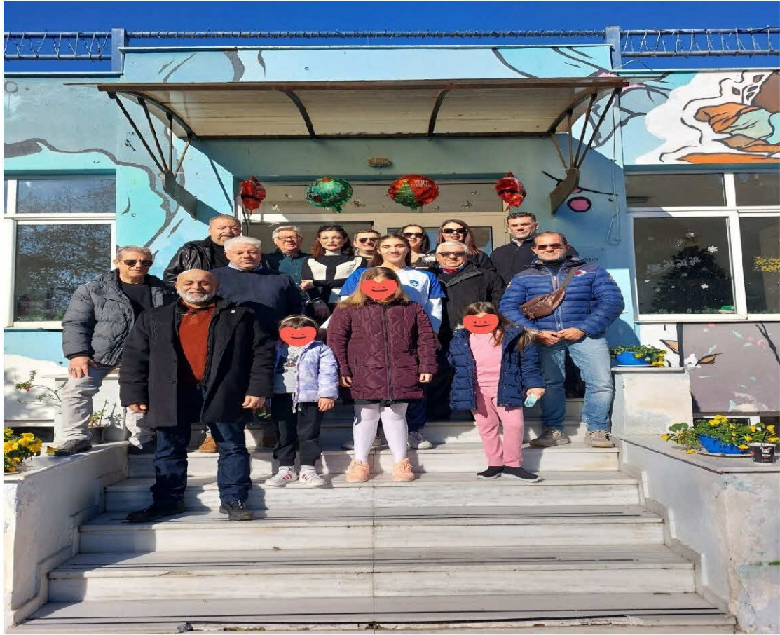
19. Δωρεά του χριστουγεννιάτικου τραπεζιού αγάπης στην Κιβωτό του Κόσμου.