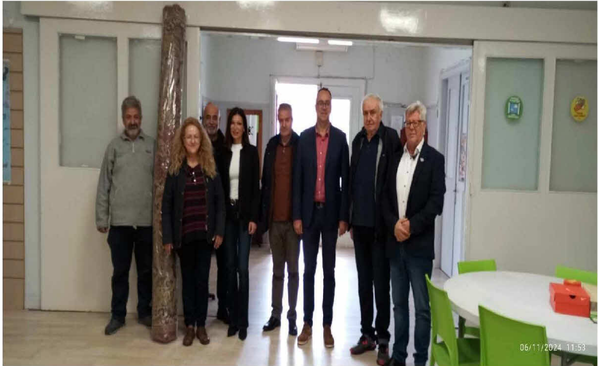
16. Διοργάνωση του καθιερωμένου Χριστουγεννιάτικου γεύματος του τμήματος.